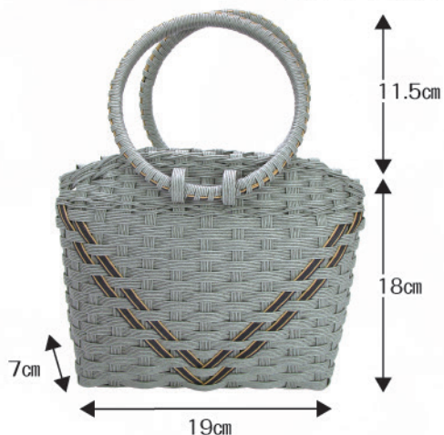
④持ち手リングのV字模様バッグ 【税込¥1,100】