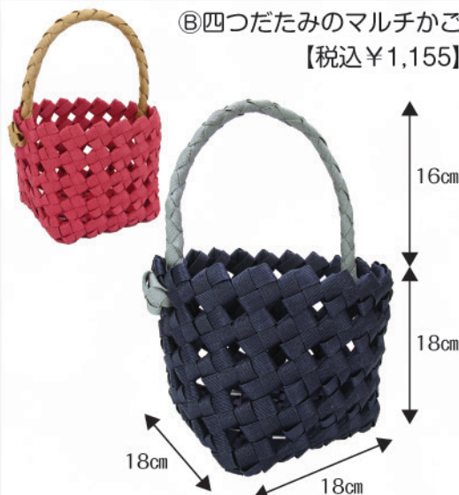
⑥四つだたみのマルチかご 【税込¥1,155】